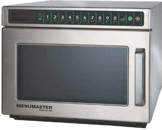
DEC18E2 Modelinin Temsili Görselidir.